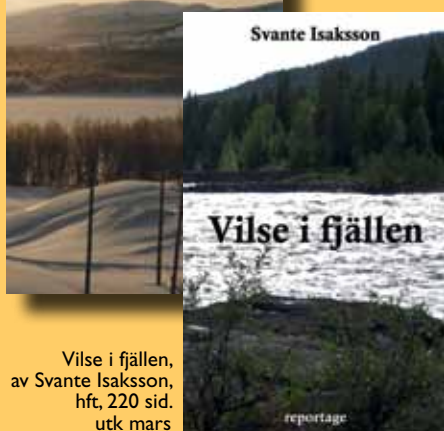
Vilse i fjällen, av Svante Isaksson, hft, 220 sid. utk mars

Ett triangeldrama mellan staten, lokala markägare och renägare, men också mellan renskötande samer i samebyarna och den majoritet samer som inte hade några rättigheter alls.