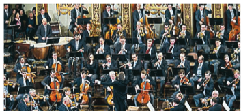
Wienfilharmonikerna 2013 med dirigent Franz Welser-Möst.